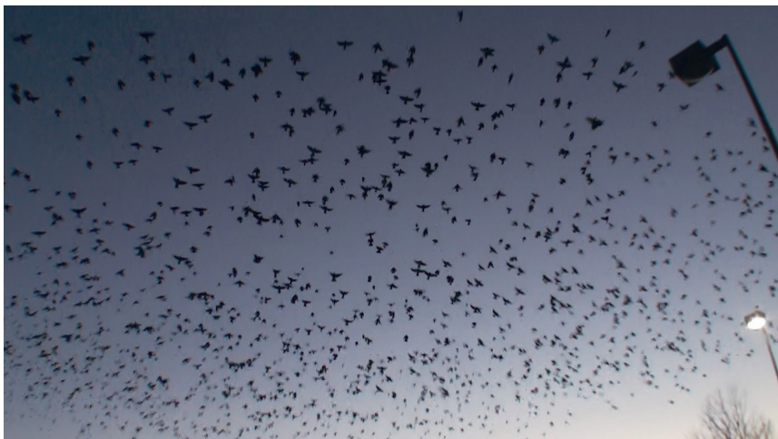
百萬飛鳥空中獻舞（最高層和中層的飛鳥，只能眼睛清楚看到，但攝影機裡卻看不到圖影，只拍到最低層飛鳥，右側是路燈）

統一，高度波浪起伏，在佛陀師父頭頂上空，現出多姿舞技。高空飛舞的鳥群，組成圓團、圈隊、扁隊、長隊，最高的一層甚至突然掉下來，猶如掉下降落傘一般，又突然整體上沖，大家一下子歡呼起來，都驚叫說像煙火爆花，就這樣表演有二十分鐘左右，都離不開佛陀師父的上空。佛陀師父很為難地說：「謝謝你們啦！謝謝你們啦！」